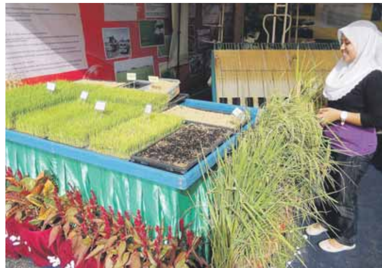
PENGGUNAAN teknologi dan baka terpilih hasil usaha penyelidikan termaju mampu meningkatkan pendapatan petani.

Oleh Mohd Zamberi Othman bhnews@bharian.com.my