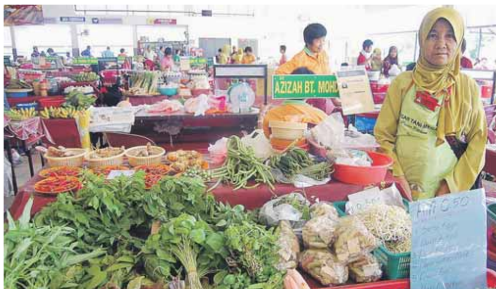
PESERTA memasarkan hasil pertanian diusahakan sendiri atau pun diperoleh daripada pembekal.