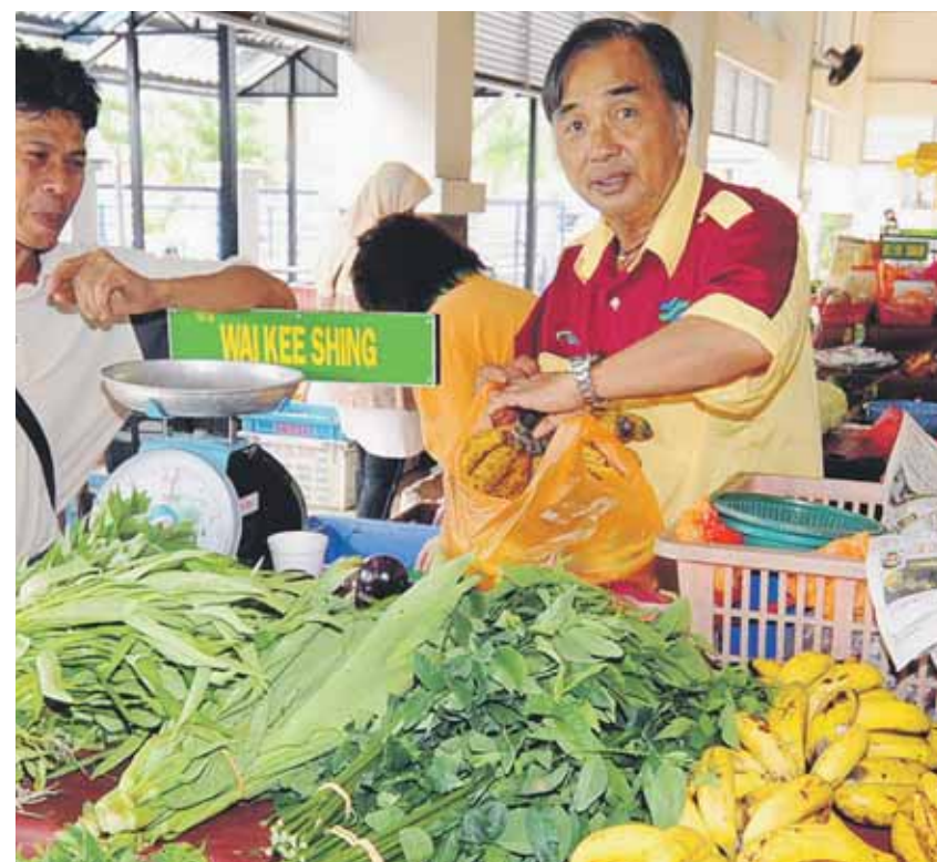
KOMPLEKS Pasar Tani Kekal yang beroperasi sejak 2008 itu disertai 81 peniaga yang pertama seumpamanya dibangunkan di negara ini.

Oleh Ainal Marhaton Abd Ghani bhnews@bharian.com.my