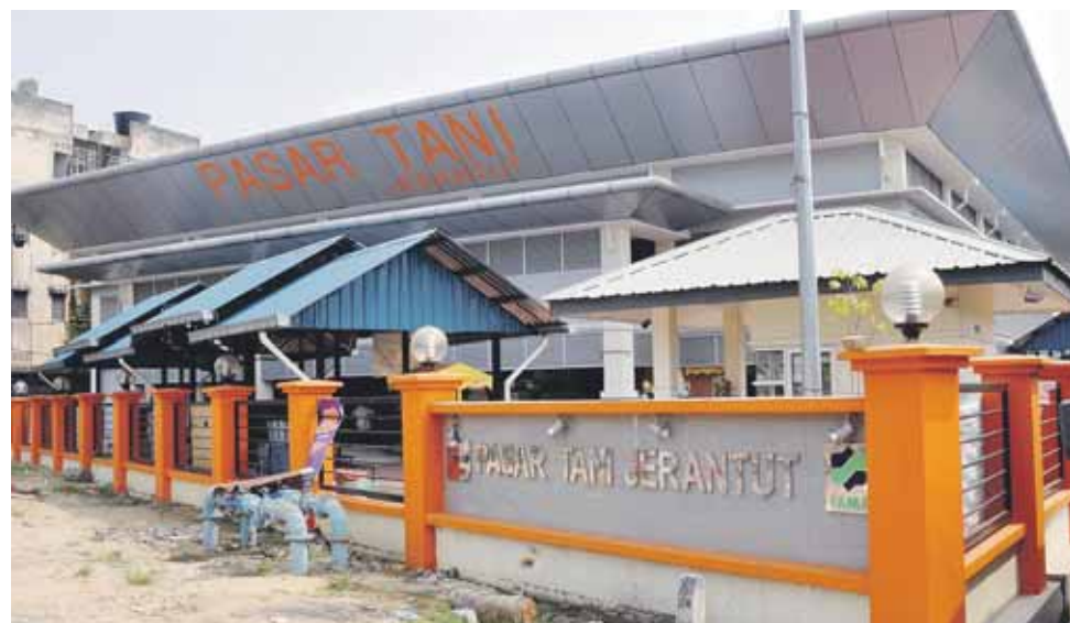
PELBAGAI kemudahan disediakan untuk memberi keselesaan kepada peniaga dan orang ramai.

● AINAL MARHATON ABD GHANI | BERITA HARIAN