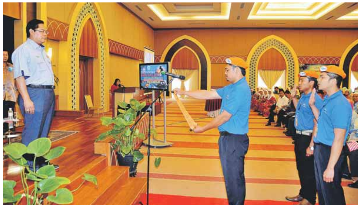
NOH mendengar pembacaan ikrar pada pelancaran gerakan Kor Tani Lembaga Kemajuan Ikan Malaysia.

golongan muda itu, sekali gus membantu petani untuk menambahkan pengetahuan terutama dalam bidang pertanian selain memperluas ilmu pertanian berlandaskan konsep sains dan teknologi.